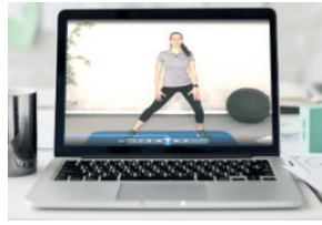
Online Übungseinheiten zu Hause 2x