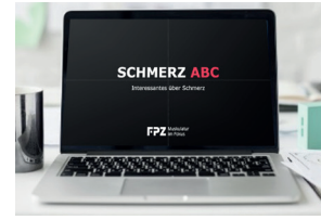
Online Edukation 1x